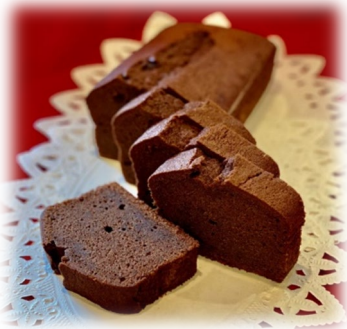
プレミアムチョコレートケーキ 税込み 200円