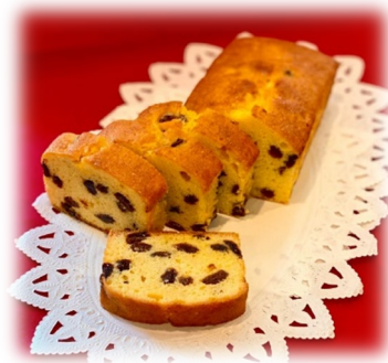
ラムレーズンケーキ 税込み 200円