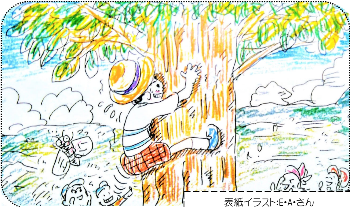
表紙イラスト:E・A・さん